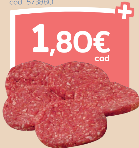
Burger bovino 150 g cod. 573880