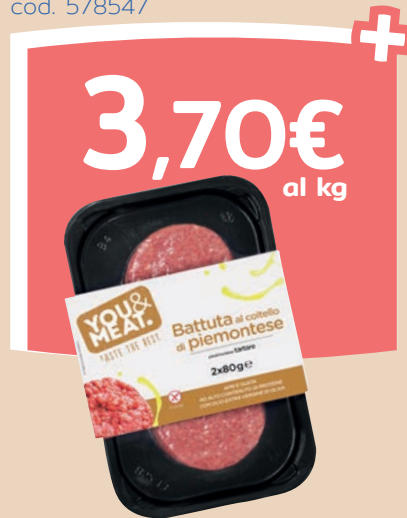
Battuta al coltello cod. 578547