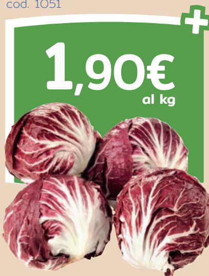
Radicchio rosso tondo cod. 1051