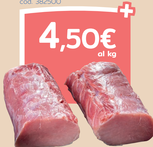
Lonza cuore di suino cod. 382500