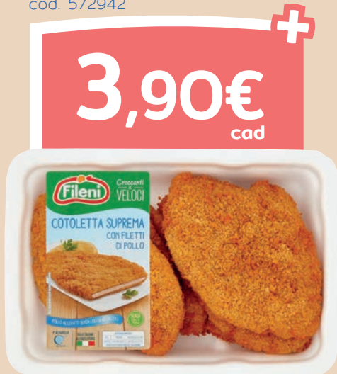
Cotoletta di pollo suprema 780 g cod. 572942