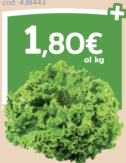
Insalata gentile cod. 438443